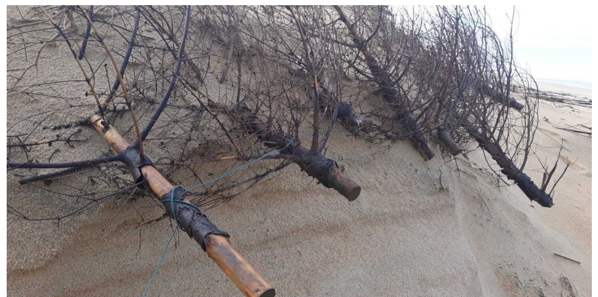
Sur la plage d'Ondres, un an après...