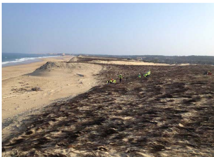
Le cordon dunaire de Capbreton a déjà tenté l'expérience. Avec des résultats positifs.

entre le 2 et le 20 janvier. Il s'agit des déchetteries de Calais Épinal, Calais Monod, Guînes, Audruicq, Oye-Plage et Peuplingues. Celles de Licques et de Louches ne participent pas : étant plus petites, la quantité de sapins attendue serait insuffisante pour rentabiliser un déplacement des services de la CCRA. Des bennes dédiées seront mises à disposition des usagers. ■